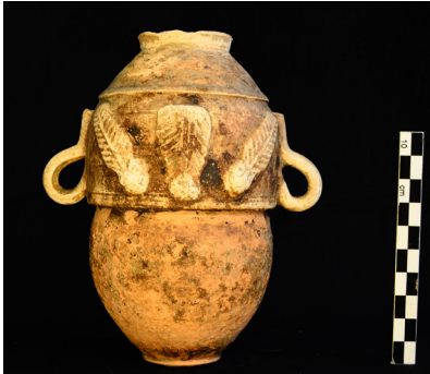
Urne funéraire, 1er siècle ZAC du Pont-du-Diable - Les Petites Roches - Avermes (03).